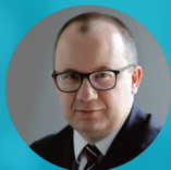
Prof. Adam Bodnar